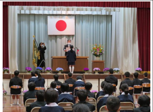
昨年度の卒業証書授与式の様子

本年度の卒業証書授与式は、3月17日（金）に予定しています。ここ数年、コロナ禍により感染防止の観点から、式への在校生の参加は一部の児童のみに制限しておりました。しかしながら、感染状況が落ち着いてきた現状や国の感染防止対策の緩和等を受け、本年度は本来、本校で行っていたように、1年生から5年生までの全在校生が式に参加し、卒業生の旅立ちを祝うことといたしました。何卒、ご理解ご協力の程、よろしくお願いたします。